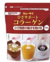
ひざサポートコラーゲン