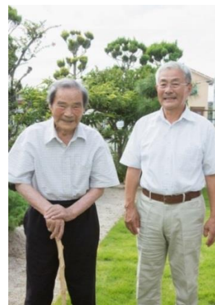
左：定さん 右：息子さん

食べ物の好き嫌いはないです。家族が一生懸命作ってくれるごはんは、とてもおいしい。出されたものは何でもおいしい、ありがたいと思って皆でいただくのが礼儀だし、それが家族団らんだと思います。相手を気遣うことが大事ですよ。ひ孫は 8 人。遠くにいてなかなか会えませんが、孫が写真を送ってくれる。ひ孫の成長が今は何よりの楽しみです。