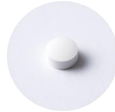
1日摂取目安量 6粒 タブレット(粒)タイプ