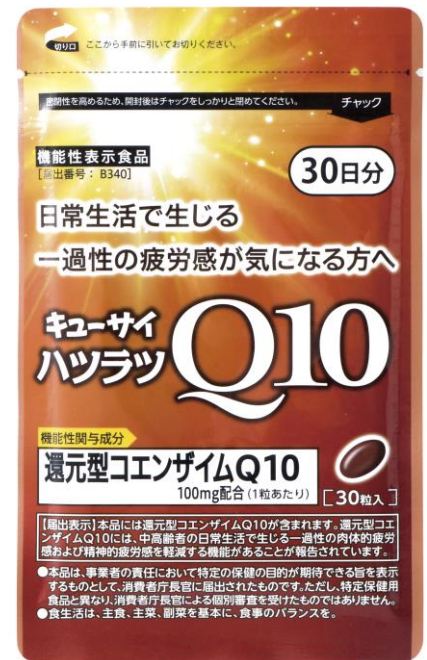
▲機能性表示食品「ハツラツQ10」商品画像