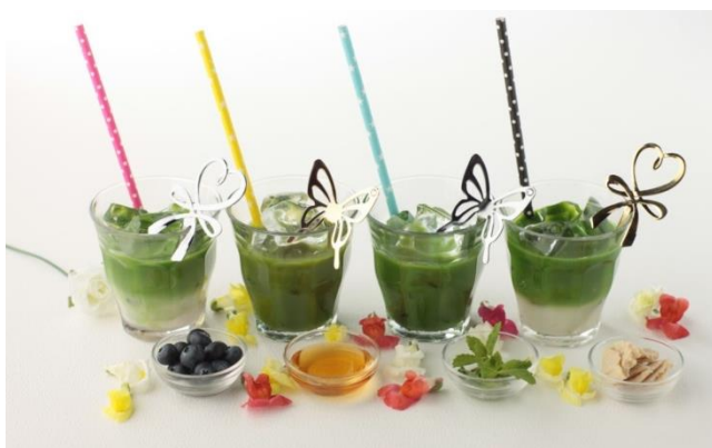
「Kale de Kale」を使ったイベント限定の特別メニュー