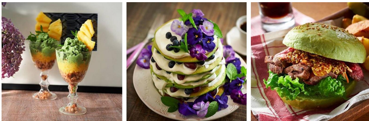
《キューサイ公式Instagramで紹介中のケール青汁アレンジレシピ例》