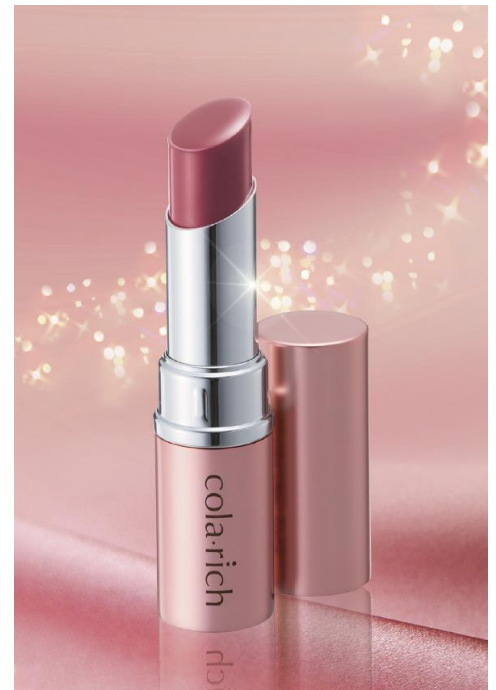
モイスチャーカラーリップ ナチュラルレッド

リップカラーの中でも、モイスチャーリップタイプはツヤや保湿効果があり、1本でメイクと保湿両方の機能を兼ね備えているのが特徴です。2017年にはリップカラー市場全体が925億円と推移する中、モイスチャーリップのシェアは56%と半数を占めており *1 、幅広い年代の女性から支持され女性のメイクには欠かせない存在となってきています。