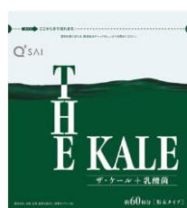
プラス ▲ザ・ケール + 乳酸菌