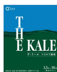
▲ザ・ケール マイルド風味