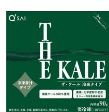
▲ザ・ケール 冷凍タイプ