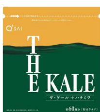
プラス ▲ザ・ケール + ハチミツ