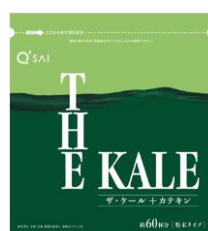
プラス ▲ザ・ケール + カテキン