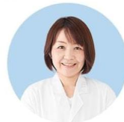
キューサイ医薬堂 お薬専任スタッフ